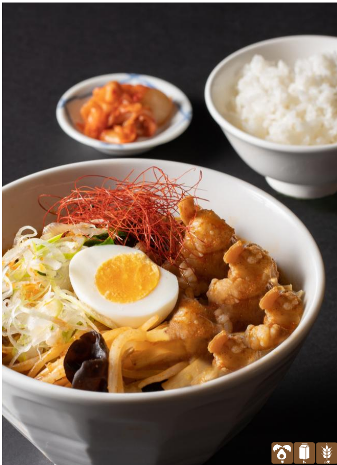
名物 北海道産 和牛モツチゲらーめん (小ライス・キムチ付) ¥1,700 Jjigae Ramen with Beef Offal (With Rice/pickles)