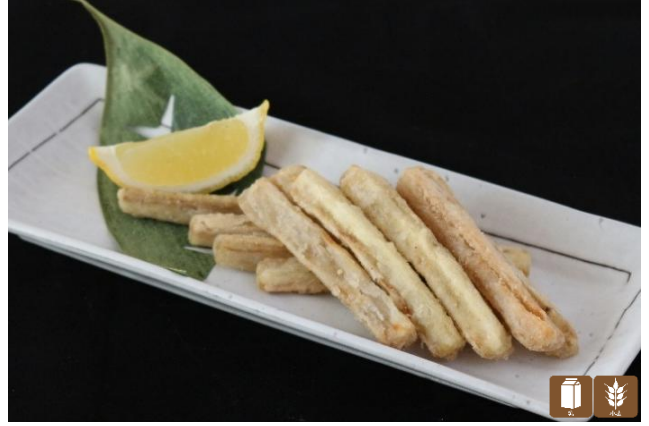
極旨 ゴボウスティック ¥650 burdock stick