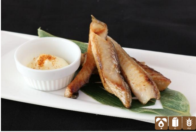
極旨 ホッケスティック ¥900 hokke stick