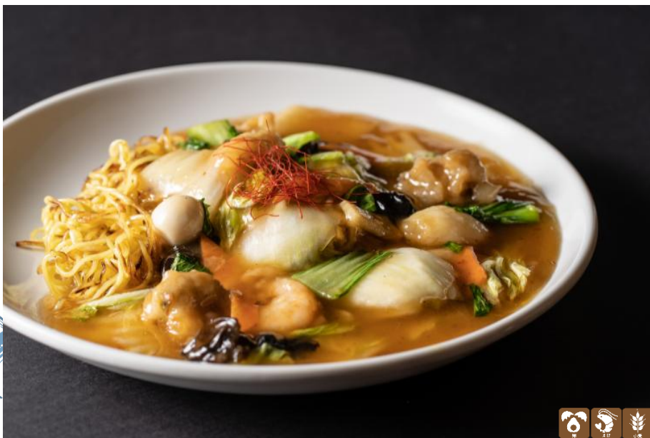
海鮮あんかけ焼きそば ¥1,700 Ankake yakisoba