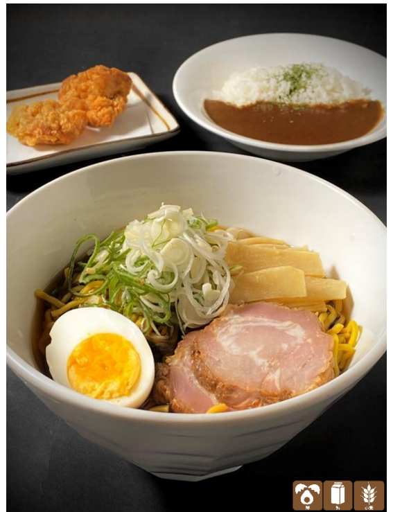
らーめんセット(醤油・味噌) ¥1,800 Ramen Set with Mini Curry Rice and Fried chicken (ミニカレー&鶏唐揚げ) ※らーめんは醤油・味噌からお選び下さい。 Choice of Ramen Soup (Soy,Miso Flavor) ※白飯ご希望の方はお申し付け下さい。 ※らーめん単品¥1,300もございます。