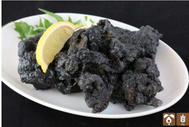
黒ダイヤ ¥900 (石炭をイメージしたザンギ) Hokkaido-style fried chicken (looks like charcoal)

※由仁町は明治時代から空知地方（夕張など）で採掘された石炭を室蘭港へ運ぶための鉄道輸送ルートの要衝として発展したと言われています。