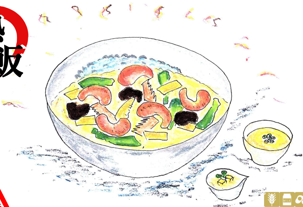
海老あんかけご飯 (スープ・搾菜・デザート付) Shrimp sauce over rice (With soup, Pickles, dessert)