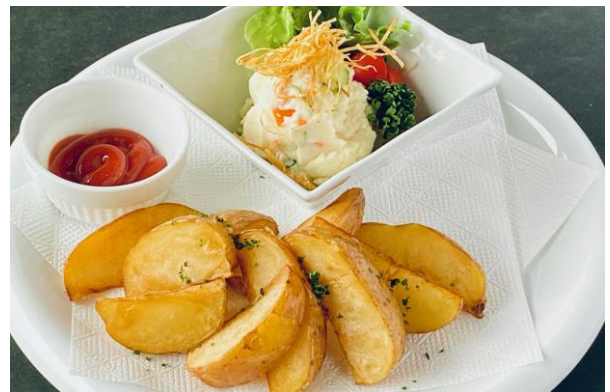
キタアカリのポテトサラダ& とうやフライドポテトセット ¥600