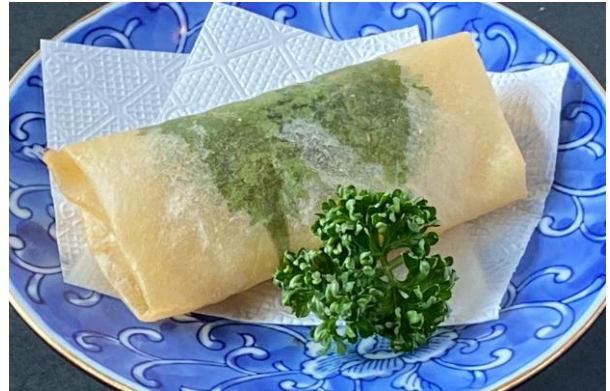
キタアカリの味噌風味チーズ春巻き ¥300