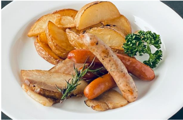
グリルベーコンとウィンナー&きたかむい ¥950