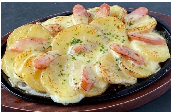
キタアカリのたっぷりチーズ焼き ¥750